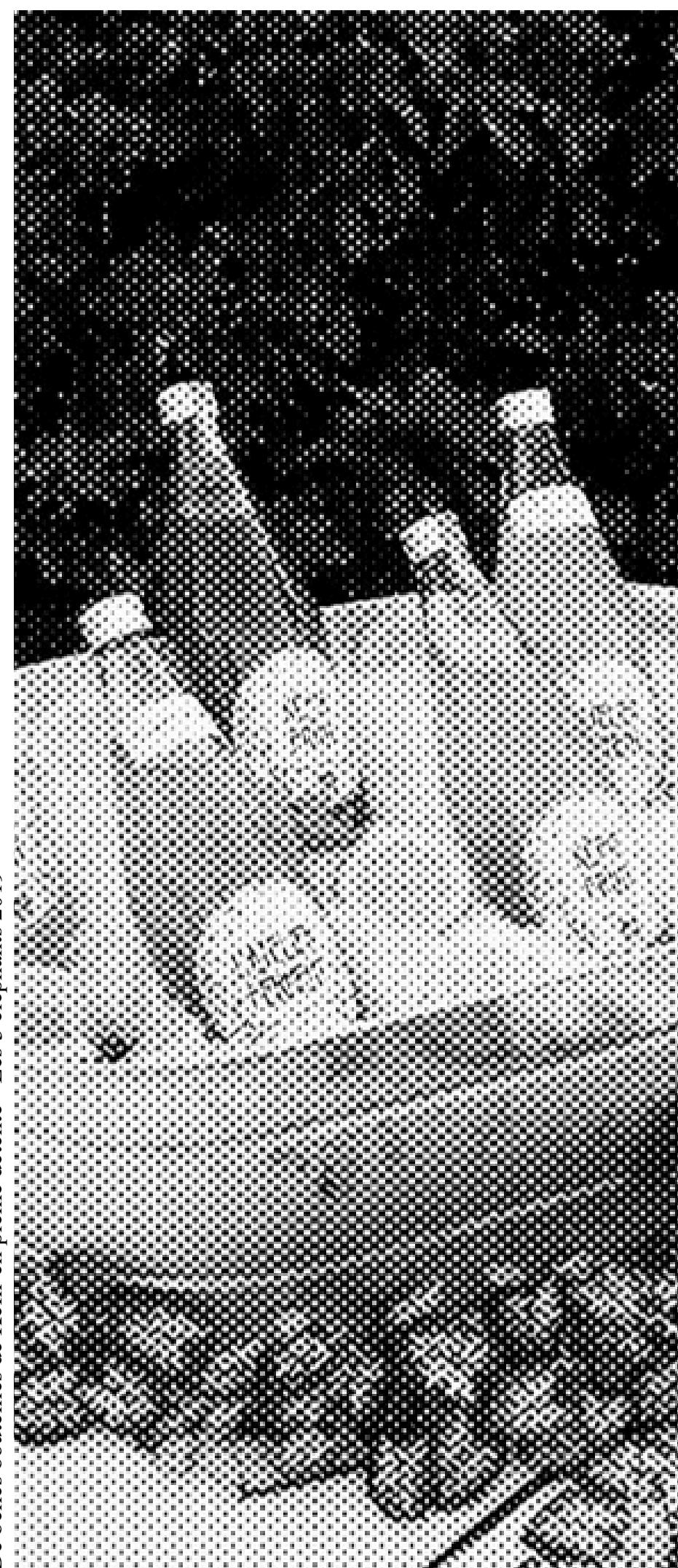
De belles bouteilles de Kefir en pleine détente - Les 3 éléphants 2019

Sam Sauvage est à retrouver aujourd'hui au Square de Boston dès 21h !