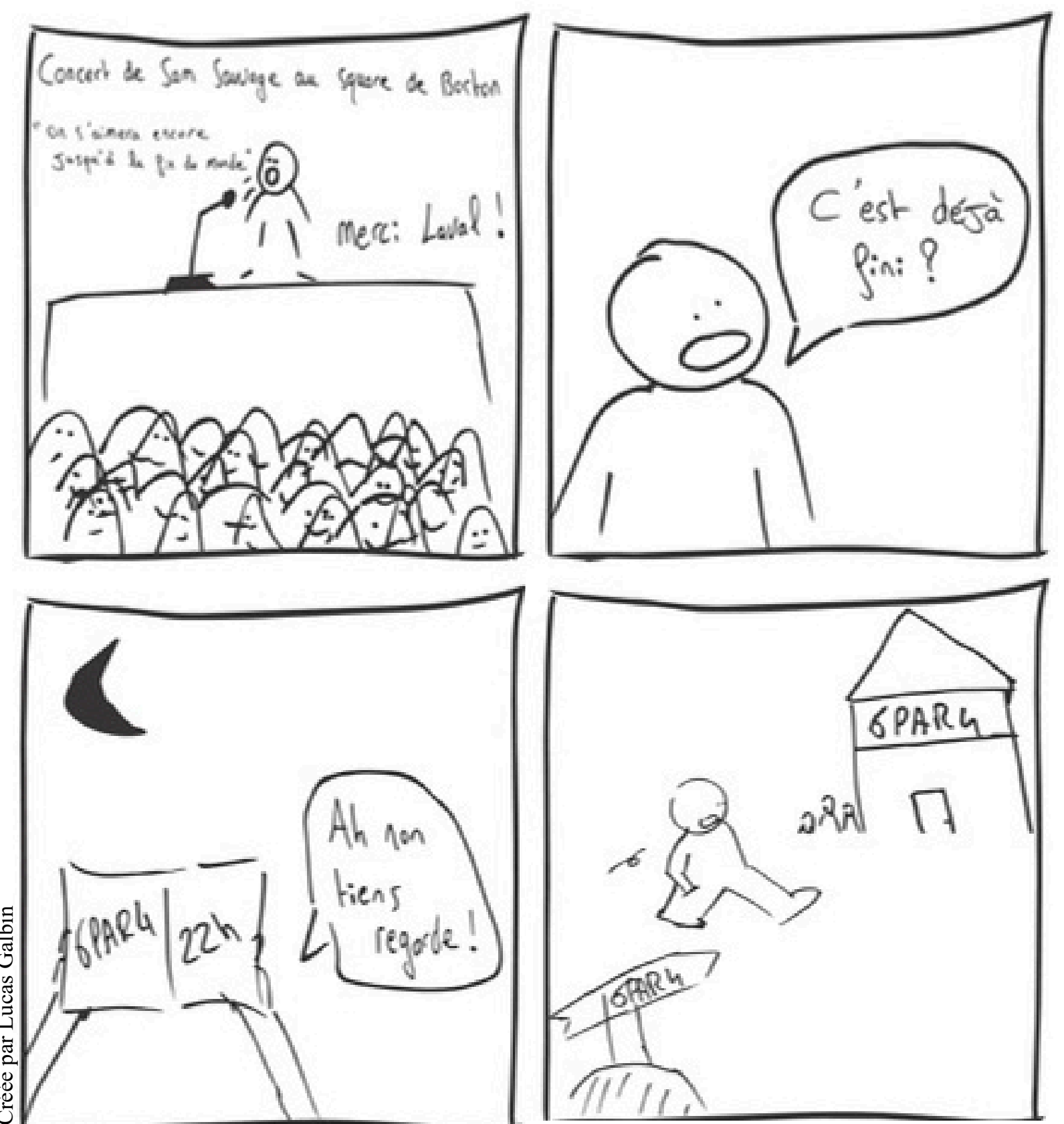
Créée par Lucas Galbin