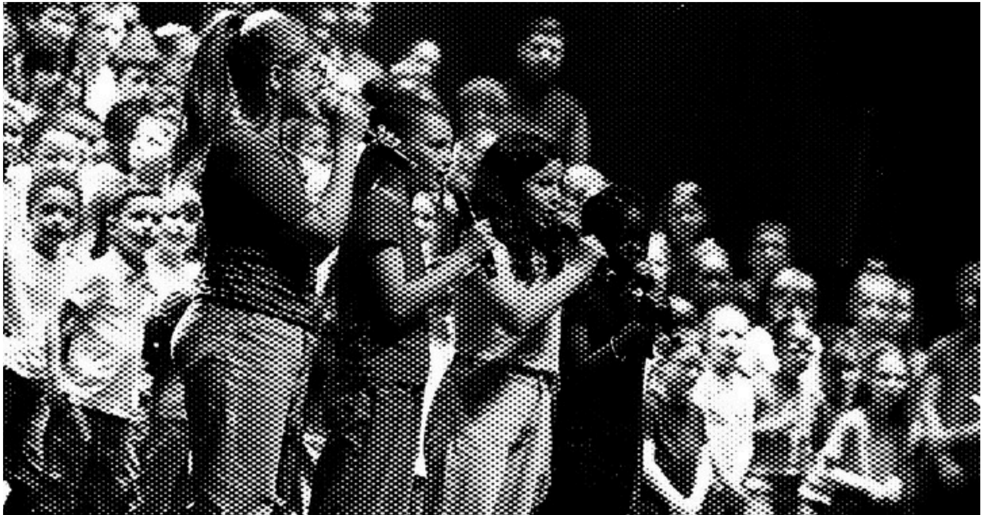
Multipistes 2024 au Théâtre de Laval

Et croyez-nous, la barre est haute : les morceaux sont choisis parmi les artistes programmés dans les salles et les festivals du territoire mayennais.