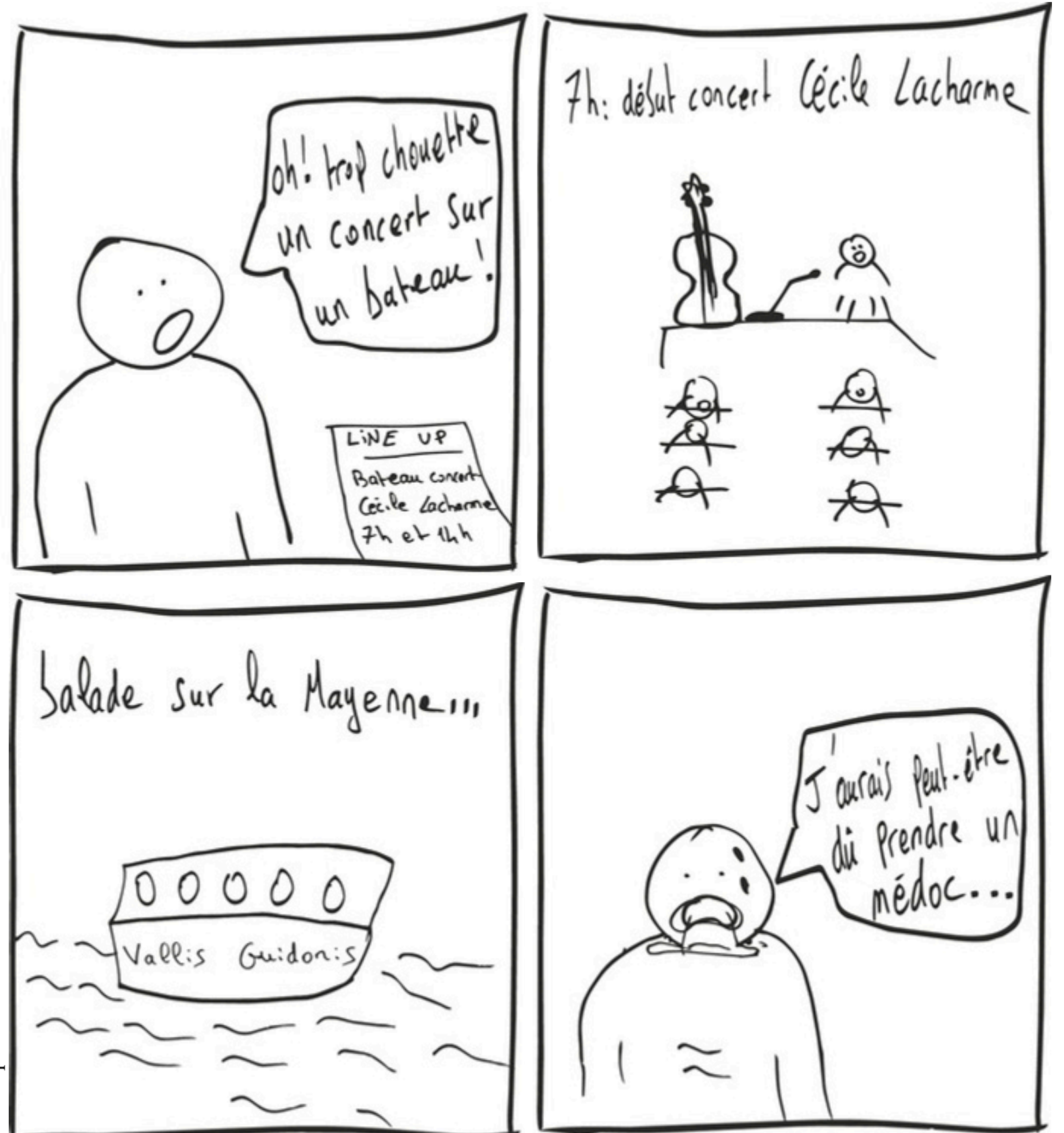
Créée par Lucas Galbin